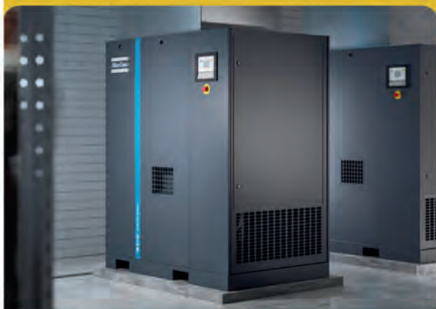
Compresores de aire de Atlas Copco

Contamos con una gama completa de productos de tecnología avanzada, garantizados para satisfacer las necesidades de las industrias modernas, asegurando una alta eficiencia energética y confiabilidad.